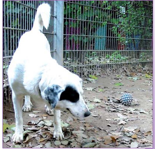
Bella: »Meine Zeit im Tierheim.«