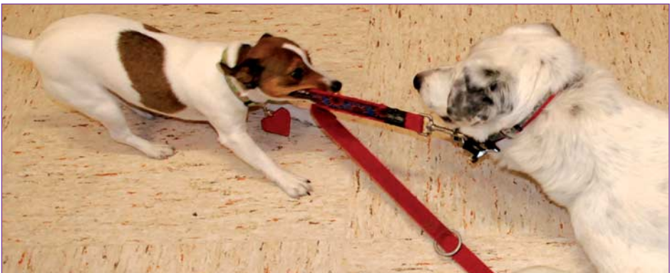
Bella: »Ich weiß es nicht, was Muchu von mir will, doch ich lasse es mir von ihr alles gefallen.«